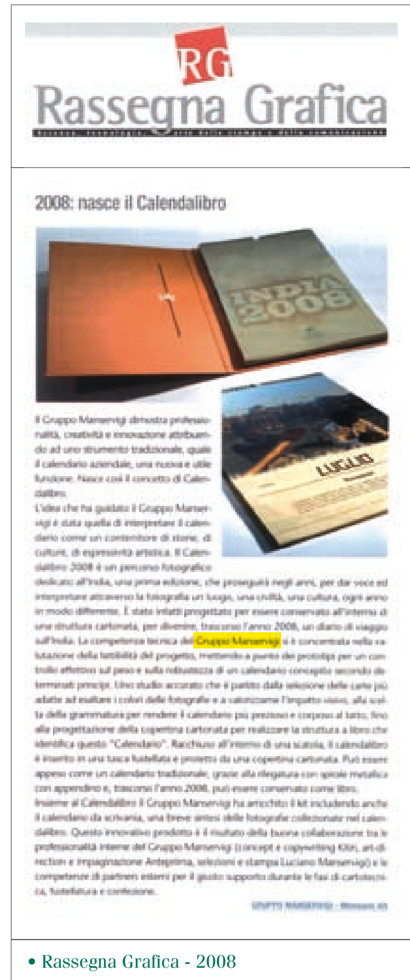
• Rassegna Grafica - 2008

Il calendario pubblicato sulle principali riviste di grafica ed economia.