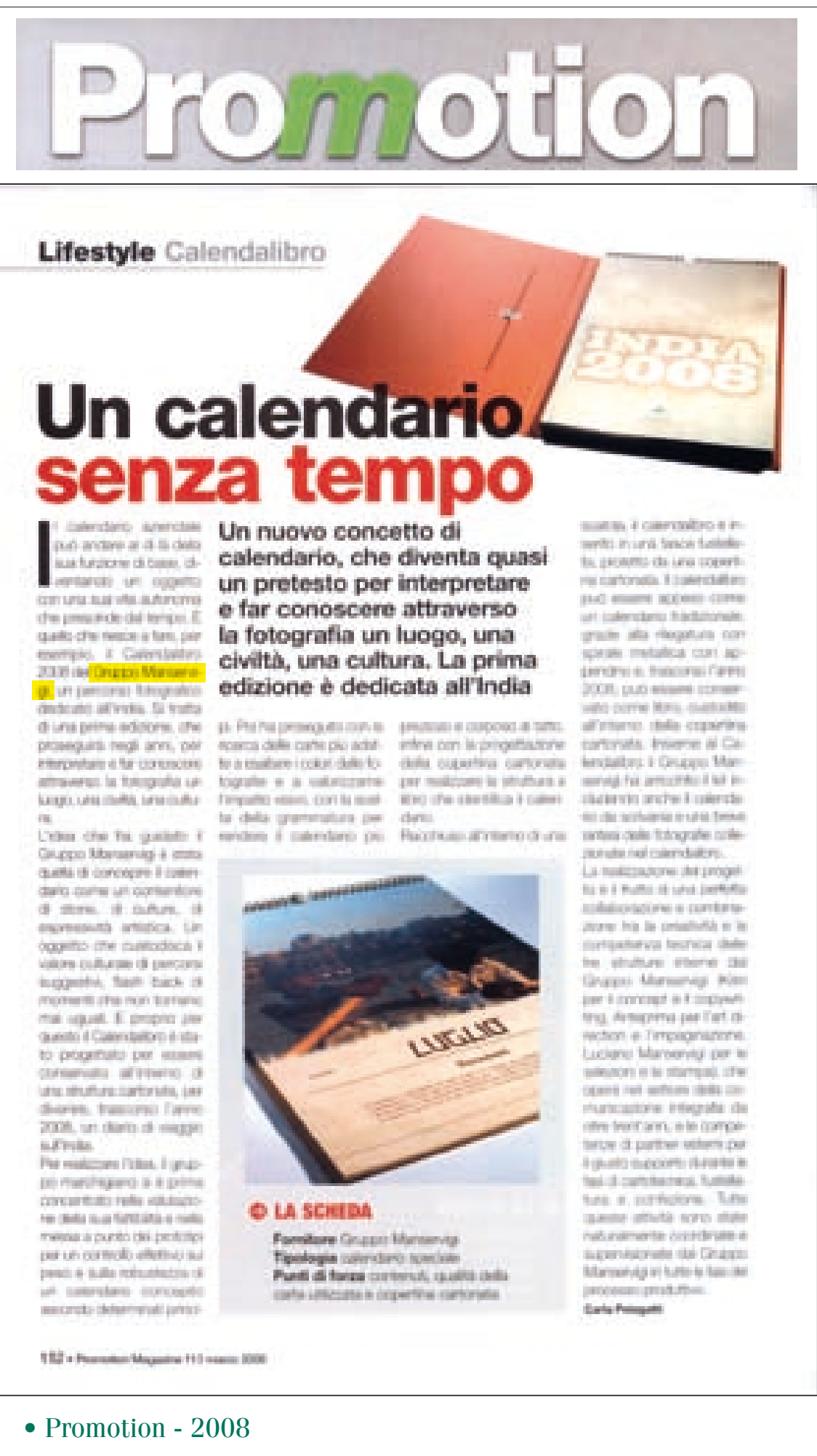
• Promotion - 2008