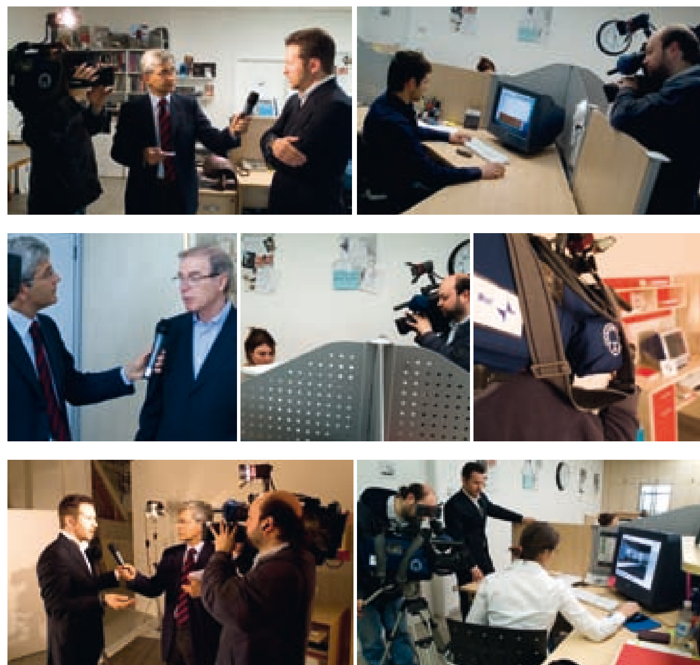
• TG Marche e Rai Stereo 3 - 2006

Il servizio è andato in onda giovedì 11 maggio 2006, su Rai Stereo 3 durante il radiogiornale del mattino e durante il TG delle Marche di RaiTre, alle ore 12.30 e 19.30.