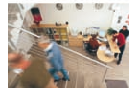
• Mondolavoro - 2006